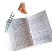
Ruban EM double face 165 mm