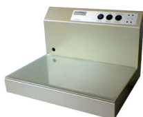
ADV 800 S